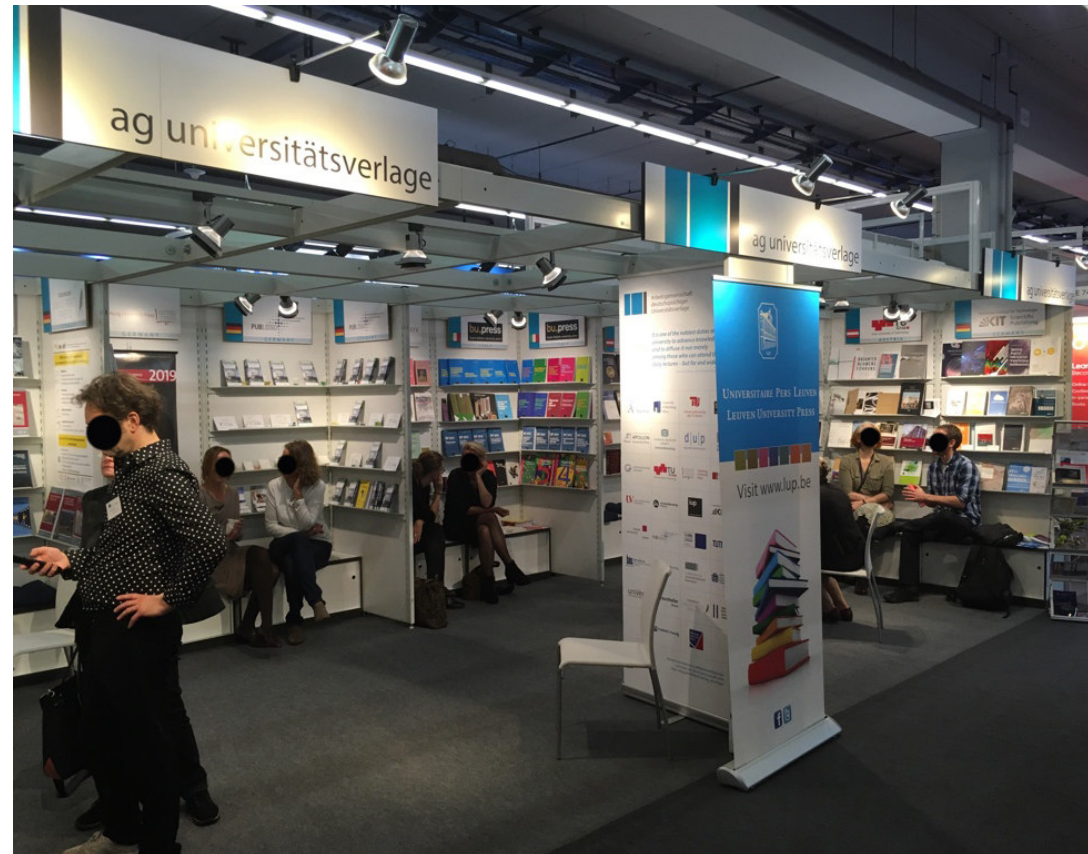
Gemeinschaftsstand auf der Frankfurter Buchmesse 2019